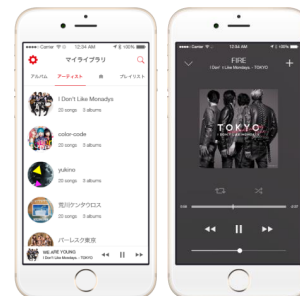
Fans' Player 画面イメージ

Google Play https://play.google.com/store/apps/details?id=jp.co.faith.fansapp