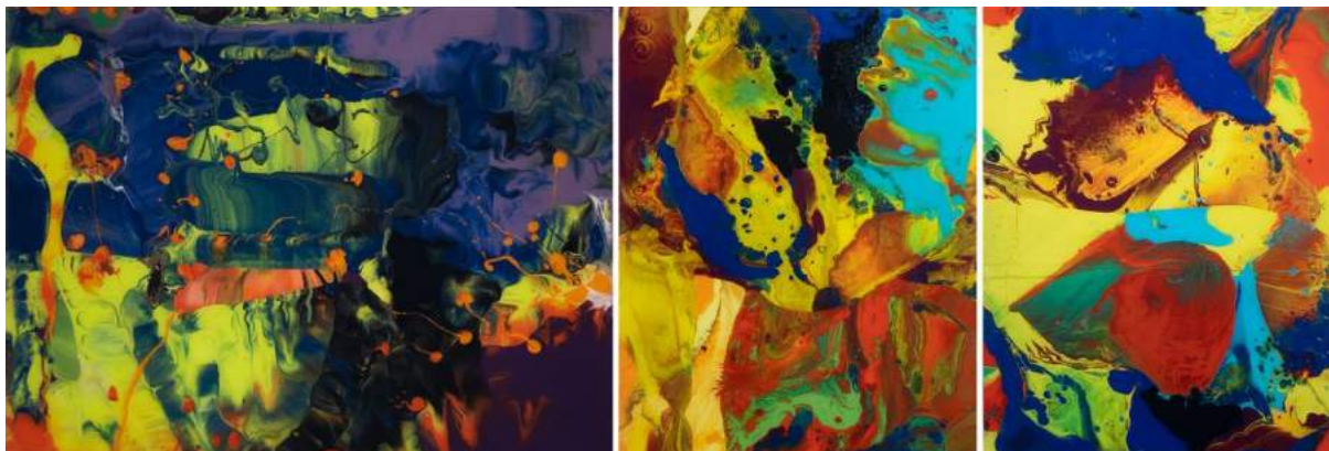
左から Aladin(1,100,000 円+税)、Bagdad(1,100,000 円+税)、Bagdad(1,100,000 円+税)

期間: 2019年4月16日(火)~5月12日(日) ※下記「PLUSTOKYO」営業時間に準じます