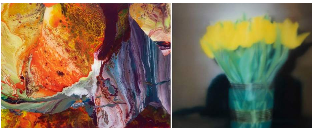
左から Ifrit(1,100,000 円+税)、Tulips(1,400,000 円+税)