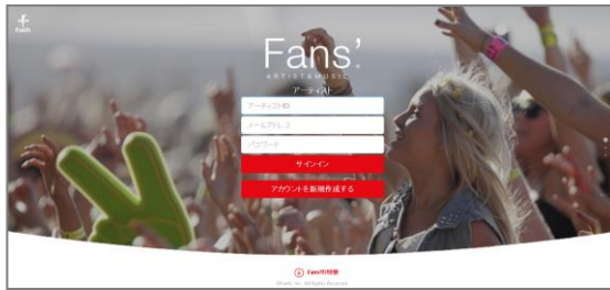
ログイン及びアカウント取得画面イメージ