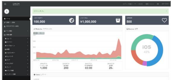
管理画面イメージ