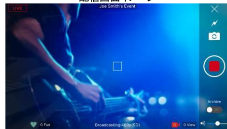
撮影画面イメージ