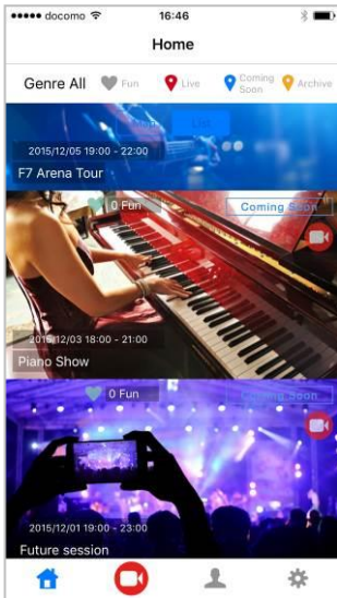
タイムラインイメージ

VIDEO Clipper はイベント・ライブを複数のカメラで同時に撮影し、ストリーミング配信するサービスです。一番最初に撮影を開始したユーザーがイベントを立ち上げ、2台目以降のカメラマンとしての参加は、最初の撮影者の承認設定(都度承認・GPS エリア内自動承認・時間自動承認・承認なしから選択)に従います。視聴者は、カメラマンとして参加したユーザーの撮影した全ての映像を、好みのアングルに切り替えながらライブ視聴し、コメントを投稿することができます。ユーザーの設定により、配信されたライブ動画は7日間アーカイブとしてサーバー内に保存されます。