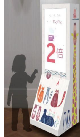
什器はお子様にも安全な設計で、空間の雰囲気も意識したデザイン

放映店舗： イオンレイクタウン kaze、イオンモールつくば、イオンモール多摩平の森、イオンモールむさし村山、イオンモール座間、イオンモール成田、イオンモール千葉ニュータウン、イオンモール富津、イオンモール木更津、イオンモール堺鉄砲町、イオンモール神戸南