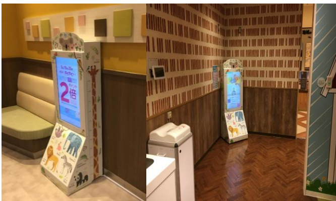
ベビールーム設置ロケーション