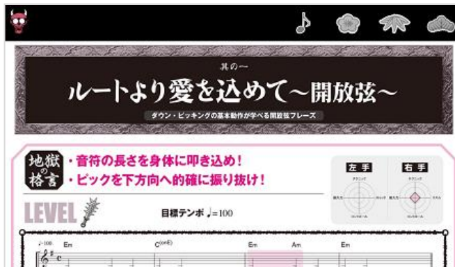
(画像 2)解説 画面