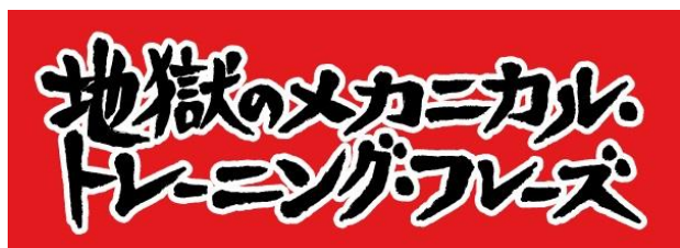
(画像 5)アプリ ロゴ