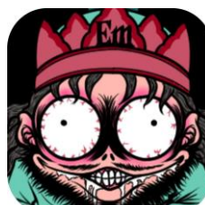
(画像 6)アプリ アイコン