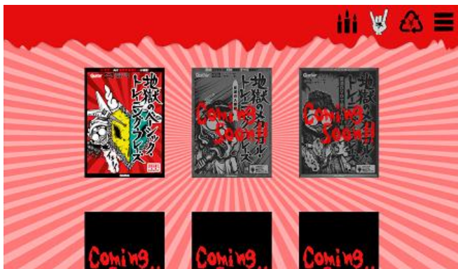
(画像 1)アプリ TOP 画面